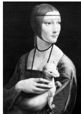
Leonardo Da Vinci, A dama com o arminho