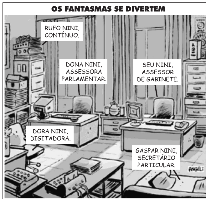
(Folha de S. Paulo, 8/4/2009, p. A2)