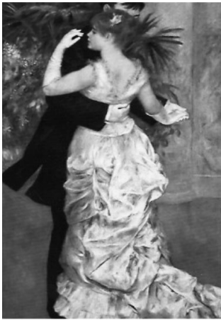
Renoir, Dança na cidade