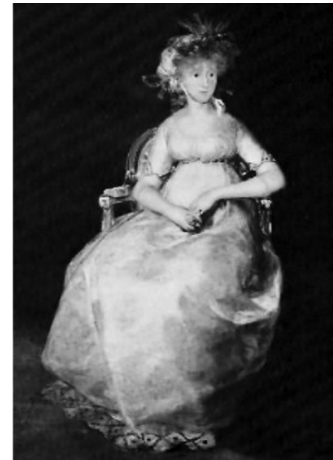
Goya, A Condessa de Chinchón