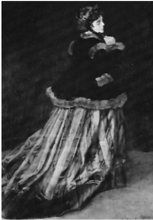
Monet, Camille ou dama com vestido verde