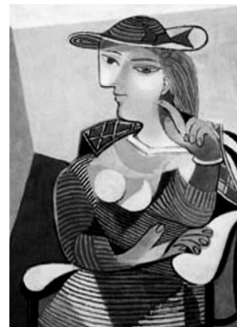
Pablo Picasso, Mulher sentada